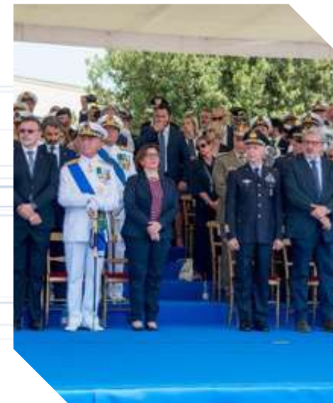
GIORNATA DELLA MARINA MILITARE ITALIANA COMANDO DELLA STAZIONE NAVALE DI TARANTO